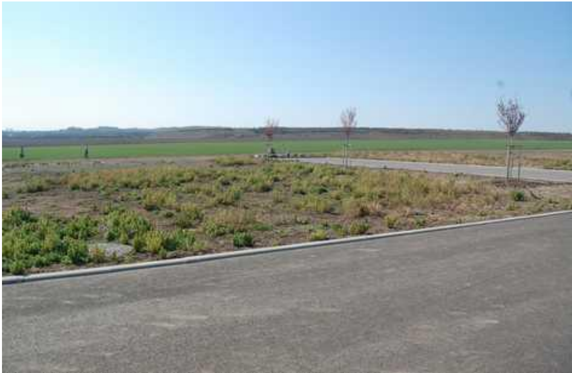
příjezdová komunikace - okolí